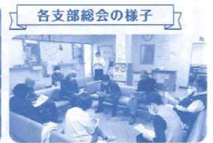
各支部総会の様子