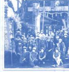
秋のウォーキング 今年も計画中です 一緒に歩きませんか?