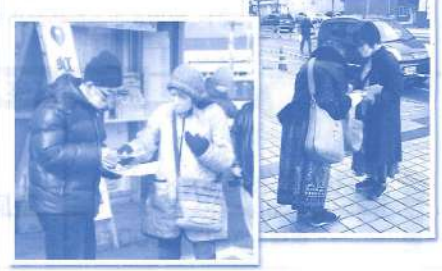
「わたしたちの地域の困った」を解決できるように組員同士と対話と交流をすすめていきます。