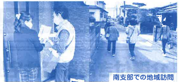
南支部での地域訪問