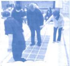
スクエアステップ体験中