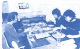
(唐松支部/下条和子)