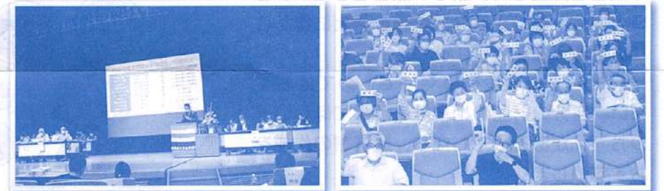
第51回 通常総代会の様子